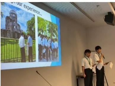
평화수장회의 청소년들에 의한 유엔 내에서 개최한 평화수장회의 청소년 포럼에서 발표 (2023 년 8 월 빈)