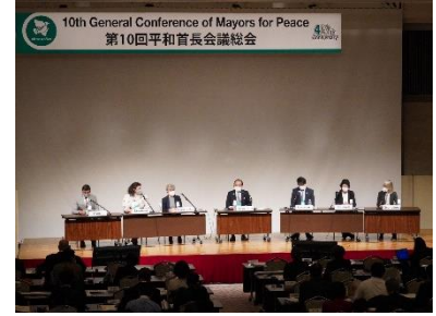
제 10 회 총회 (2022 년 10 월 히로시마시)

임원 도시가 모이는 이사회를 대략 2 년에 1 회 임원 도시에서 개최하고 향후 대책과 다음 총회의 운영 방침 등에 대하여 심의하는 것으로 하고 있습니다.