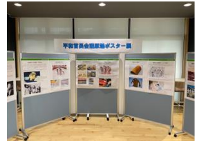
가맹 도시의 평화수장회의 원폭 포스터 전시회의 개최 (2023 년 8 월 가도가와초)