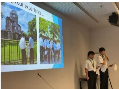
Презентация молодежи из городов-членов на Молодежном форуме, организованном «Мэры за мир» в ООН (Август 2023 года, Вена)