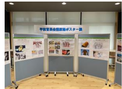
Выставка разработанных «Мэрами за мир» постеров о последствиях атомных бомбардировок (Август 2023 года, Кадогава)