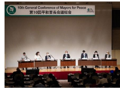
10-я Всеобщая конференция (октябрь 2022 года, Хиросима)

Административная конференция проводится раз в два года в одном из административных городов. На ней административные города обсуждают направления дальнейшей деятельности организации и план следующей Всеобщей конференции.