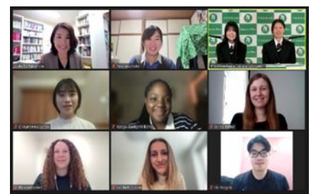
Открытие вебинара мирного просвещения с молодежью из городов-членов (Февраль 2024 года, Хиросима)