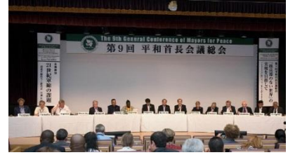
第 9 届大会 (2017 年 8 月 长崎市)

干部城市理事会大致 2 年 1 次在干部城市召开，审议今后的活动和下次大会的运营方针等。