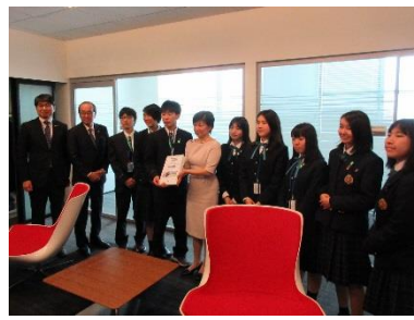
参加签名活动的高中生亲手将 签名交给联合国相关者 (2019年4月 纽约)