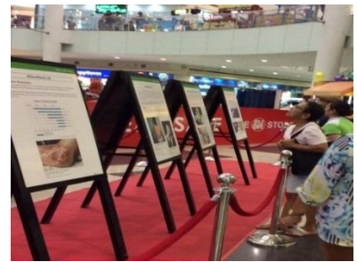
加盟城市举办的和平首长会议 原子弹爆炸海报展 (2015年6月 文珍俞巴)