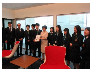
Школьники передают собранные подписи сотрудникам ООН (апрель 2019, Нью-Йорк)