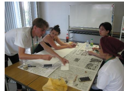
Участники обменов по программе «Мэров за мир» для молодежи из городов-членов участвуют в обсуждениях в рамках летнего курса «ХИРОСИМА и МИР НА ПЛАНЕТЕ» (HIROSHIMA and PEACE) (август 2019, Хиросима)