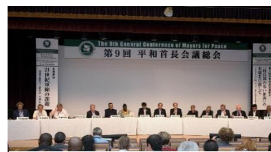
9-ая Всеобщая конференция (август 2017 года, Нагасаки)

Всеобщая конференция «Мэров за мир» проводится раз в 4 года в Хиросиме и Нагасаки поочередно, на ней города-члены обсуждают и принимают важнейшие решения.