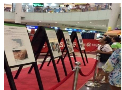
Выставка разработанных «Мэрами за мир» постеров о последствиях атомных бомбардировок (июнь 2015, Мунтинлупа)