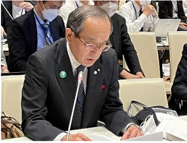
Discurso do Presidente na 1a. Reunião dos Estados-Partes no Tratado sobre a Proibição das Armas Nucleares 2022 (Viena, junho de 2022)