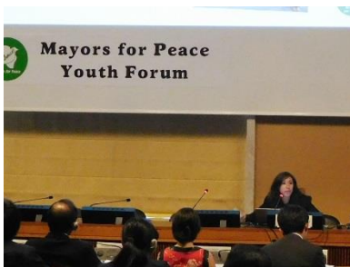
Apresentação de um jovem de uma cidade-membro no Fórum de Jovens Prefeitos pela Paz realizado na sede da ONU na Europa (Genebra, abril de 2018)