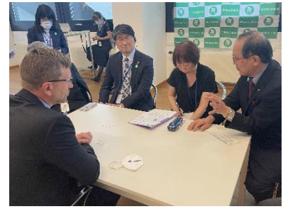
Encontro com representantes do governo de vários países (Viena, junho de 2022)