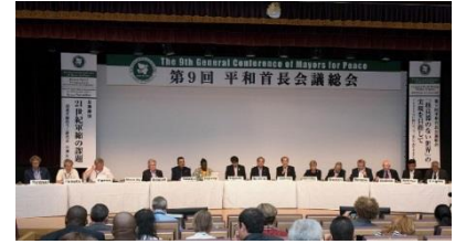
9ª Assembleia Geral (agosto de 2017, Nagasaki)

Em princípio, a Assembleia Geral reunida pelas cidades-membro realiza-se uma vez a cada quatro anos nas cidades de Hiroshima e Nagasaki alternadamente e decidem e aprovam assuntos importantes.