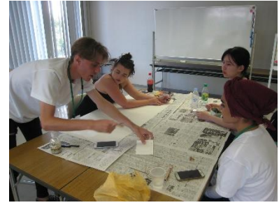
Discussão no Projeto de Apoio à Juventude "Paz e Intercâmbio" (HIROSHIMA e PAZ) por jovens das cidades-membro (Hiroshima, agosto de 2019)