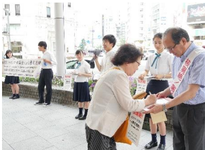
Realização da campanha de abaixo-assinado na rua pelo presidente e estudantes de escola de ensino médio (Hiroshima, julho de 2019)