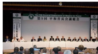
9a. Conferencia General (Agosto de 2017 en Nagasaki)

Por norma general, la Conferencia General en la que se reúnen todas las ciudades miembro se celebra cada cuatro años, alternativamente en las ciudades de Hiroshima y Nagasaki. En la Conferencia General se deciden y aprueban los asuntos que son importantes para la organización.