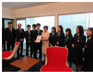
Presentación de firmas a representantes de la ONU por los estudiantes de secundaria que participaron en la campaña de petición de firmas (Abril de 2019, Nueva York)