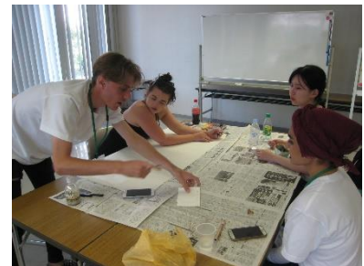
Debate entre jóvenes de las ciudades miembro durante el Programa de intercambio juvenil por la paz "HIROSHIMA and PEACE" (Agosto de 2019, Hiroshima)