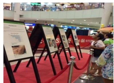
Allestimento della Mostra dei Poster sulla Bomba Atomica di Sindaci per la Pace da parte di una città associata (giugno 2015, Muntinlupa)