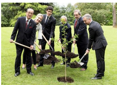
Cerimonia di piantumazione di un germoglio di seconda generazione di un Ginkgo bombardato, da parte di una città associata (aprile 2018, Guernika-Lumo)