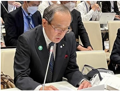
Discorso del presidente al primo convegno degli Stati firmatari del Trattato per la Proibizione delle Armi Nucleari 2022 (Vienna, giugno 2022)