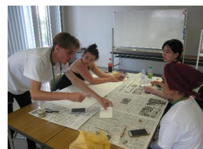
Dibattito, nell'ambito dell'attività di supporto all'"Incontro con la Pace" ("HIROSHIMA e PACE"), realizzato dai Giovani di Sindaci per la Pace (agosto 2019, Hiroshima)