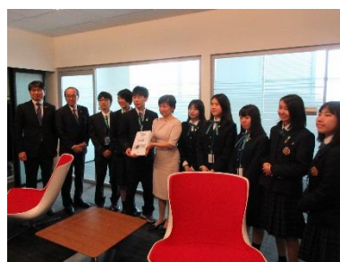
Presentazione delle firme ai paesi membri dell'ONU, da parte di studenti delle scuole superiori che hanno partecipato alla raccolta di firme (aprile 2019, New York)