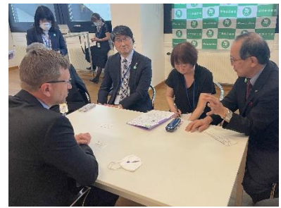
Incontro con i rappresentanti dei governi nazionali (Vienna, giugno 2022)