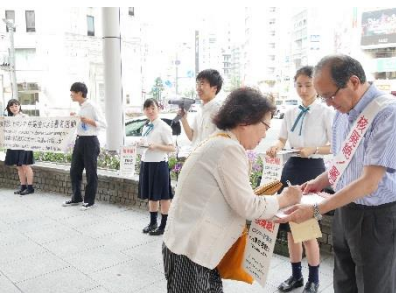
Raccolta di firme in strada da parte del presidente e di studenti delle scuole superiori (luglio 2019, Hiroshima)