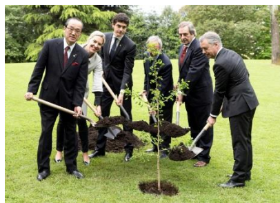
Cérémonie de plantation d'un Ginkgo, arbre de deuxième génération, survivant de la bombe atomique par une ville membre (Avril 2018, Guernika-Lumo)