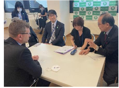
Rencontre avec les représentants de gouvernements nationaux (Juin 2022, Vienne)