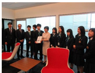
Présentation d'une pétition à un représentant de l'ONU par des étudiants (Avril 2019, New York)