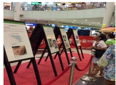
Présentation d'une exposition sur la bombe atomique par une ville membre (Juin 2015, Muntinlupa)