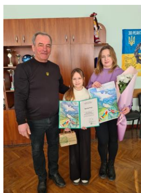
Nova Ushytsia, Ukraine

Nous espérons que le concours d'art pour enfants "Villes pacifiques" donnera aux enfants l'occasion d'être sensibilisé à la paix en créant des œuvres d'art. Cette année, nous prévoyons d'organiser le concours d'art pour enfants "Villes pacifiques" 2024, et nous attendons avec impatience la participation de votre collectivité !