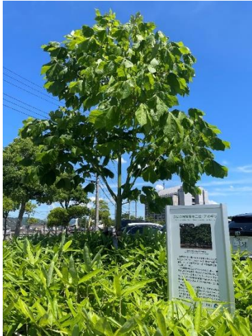
アオギリ 370cm (2022年6月)

この取組を一層充実させていく際の参考とするため、2016年度に配布した被爆樹木二世の苗木の生育状況の調査を実施しました。全国各地の加盟都市から、平和の象徴として大切に育てられている被爆樹木二世の苗木が元気に育つ様子を伝える写真が寄せられました。