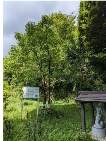
クスノキ 400cm (2022年8月)

事務局に寄せられた被爆樹木二世の苗木の写真は、平和首長会議ウェブサイトの「被爆樹木二世の苗木の配付・育成」ページの「配布先リスト」からご覧いただけます。平和首長会議ウェブサイトでは、各加盟都市による被爆樹木二世を活用した市民の平和意識醸成のための取組についてもご紹介していますので、併せてご覧ください。