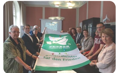
Iniciativa Anual Día de la Bandera

Alemania es ahora el hogar del tercer mayor número de ciudades miembro de Alcaldes por la Paz en el mundo después de Japón e Irán.