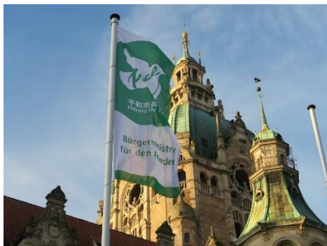
Bandera de Alcaldes por la Paz frente al Ayuntamiento de Hannover (Foto: Cortesía y material protegido por derechos de autor de la ciudad de Hannover)

https://www.hannover.de/Service/Presse-Medien/Landeshauptstadt-Hannover/Aktuelle-Meldungen-und-Veranstaltungen/%22Frieden-2020-%22-Veranstaltungsreihe-wird-digital-umgesetzt