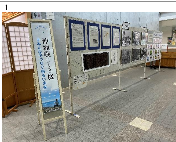
取組み③ 沖縄戦(いくさ)展～#みんながつなぐ明るい未来～