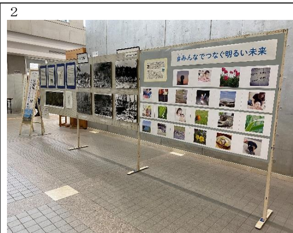
取組み③ ← 2で、「#(ハッシュタグ)でつなげる未来の平和」(取組み①)で投稿された写真を展示