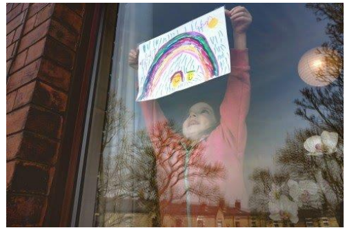
Chica poniendo una foto del arco iris en la ventana (Manchester)