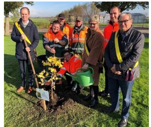
Ceremonia de plantación en Veurne, Bélgica, en noviembre de 2019

Ciudades miembro, ¿por qué no intentan también levantar un árbol de bombas atómicas de segunda generación?