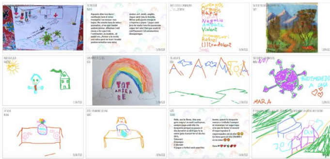
Dibujos realizados por niños (Barcelona)