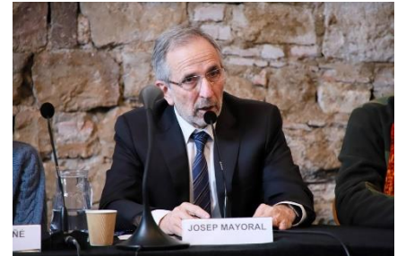
(Arriba) Reunión el 20 de febrero (Abajo) Alcalde de Granollers hablando en la reunión