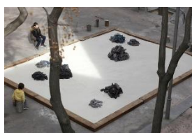
◀ Instalación en 2016 con el tema de los hibakushas