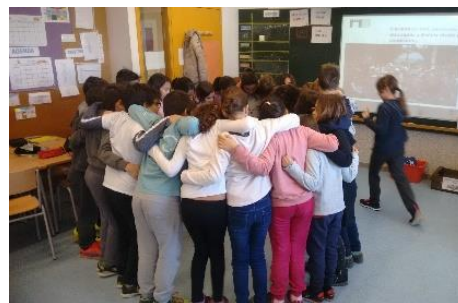
▲ Actividad escolar en 2016

Un total de 1.400 niños de 9 a 10 años han participado en el proyecto y 4.000 adultos han participado indirectamente en el proyecto visitando una instalación de arte. Para este año, cinco escuelas de 11 escuelas públicas se unieron a esta iniciativa. El número de escuelas participantes cambia de año en año, pero el organizador espera involucrar a todas las escuelas.