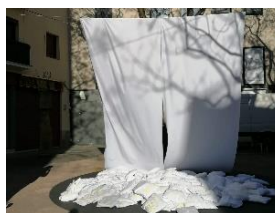
◀ Instalación en 2020 con el tema del antimilitarismo