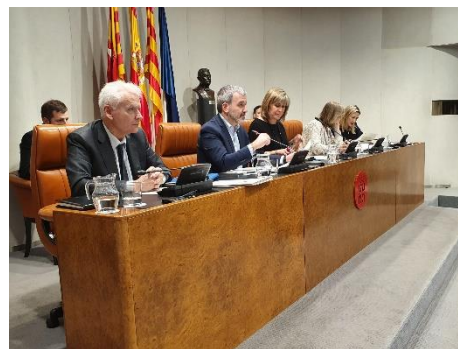
Sesión plenaria de la Diputación de Barcelona

La Diputación de Barcelona, que es un organismo de gobierno local de segundo nivel compuesto por los 311 municipios de la provincia de Barcelona, también adoptó una declaración institucional en apoyo de TPNW en su sesión plenaria el 27 de febrero.