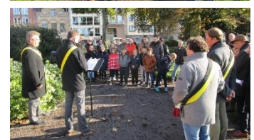
Ceremonias en Gante, Veurne e Ypres

<Informe de Filip Deheegher, Ciudad de Ypres, sección principal de la ciudad de Bélgica>