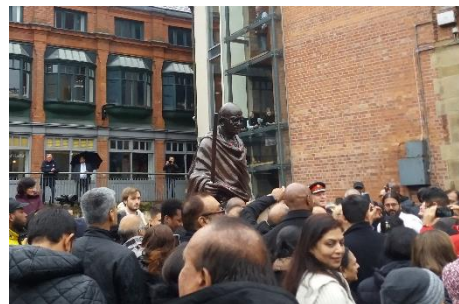
Ceremonia de inauguración el 25 de noviembre

El 25 de noviembre, en la catedral de Manchester, se celebró un servicio y una ceremonia de varias religiones para desvelar una estatua de Mahatma Gandhi, un líder fundamental de ideas del siglo XX en torno a la acción no violenta para perseguir objetivos políticos. Gandhi había visitado Manchester y Lancashire en 1931 para reunirse con trabajadores textiles. 2019 es el 150 aniversario de su nacimiento. La estatua fue donada parcialmente como respuesta al ataque del Manchester Arena 2017 como una forma de compartir la diversidad multicultural y de fe de Manchester.