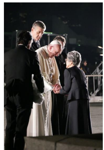
El Papa y un representante de hibakusha en la reunión de Hiroshima

https://www.youtube.com/watch?v=jN19rLPy0CM