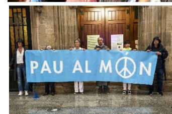
(La sección catalana de Alcaldes por la Paz)