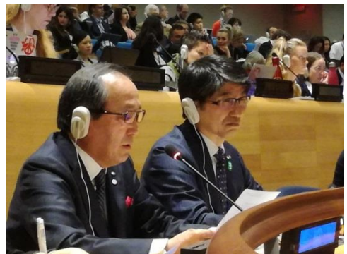
Alcaldes de Hiroshima y Nagasaki entregando declaraciones el 1 de mayo

▼ Declaraciones de los Alcaldes de Hiroshima y Nagasaki a la PrepCom NPT 2019 (sitio web de Alcaldes por la Paz): Alcalde de Hiroshima / Alcalde de Nagasaki