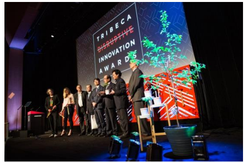
La 10a Ceremonia Anual de los Premios de Innovación Disruptiva de Tribeca

Alcaldes por la Paz ha sido galardonado con la décima edición de los Premios Tribeca de innovación disruptiva presentados en colaboración con el Festival de cine de Tribeca y el profesor Clayton Christensen, de Harvard Business School, creador de la teoría de la innovación disruptiva. Los premios reconocen y elevan a quienes han desafiado las normas sociales para presentar inventos o ideas que cambian el mundo. Alcaldes por la Paz recibió el Premio Hersey, un premio que se estableció el año pasado para reconocer las contribuciones en el campo del desarme nuclear y la paz mundial.