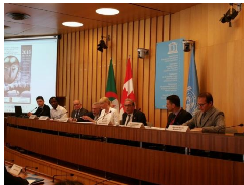
Mesa redonda sobre "Mejorar cómo vivimos juntos en las ciudades"

Celebrando el Día Internacional de Vivir Juntos en Paz (16 de mayo), proclamado por las Naciones Unidas en 2017, el Observatorio Internacional de los Alcaldes sobre la convivencia, una iniciativa de la ciudad de Montreal, organizó una mesa redonda llamada "Mejorar cómo vivimos juntos en las ciudades" en la sede de la UNESCO en París, Francia, en cooperación con la Delegación de Canadá ante la UNESCO y la Delegación Permanente de Argelia