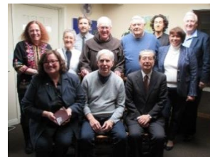
◀ Meeting with Mayor of Santa Barbara (seated front left) and officials of Nuclear Age Peace Foundation