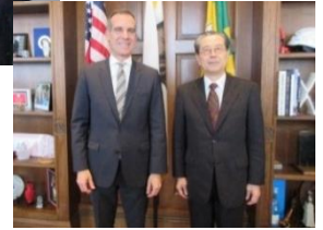
▲ Meeting with Mayor of Los Angeles