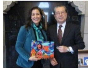
▲ Meeting with Mayor of Oakland