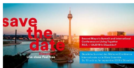
(Flyer provided by International Observatory of Mayors on Living Together)

Les 10 et 11 juin 2015, le Sommet international des maires sur le vivre ensemble s'est tenu à l'initiative de la Ville de Montréal, vice-présidente de Maires pour la paix et ville leader au Canada. Le sommet était une réunion de haut niveau des maires de toutes les régions afin de débattre des principaux défis liés à la cohésion sociale et à la diversité dans les villes du monde entier. Les discussions au sommet ont abouti à la signature de la Déclaration de Montréal sur le vivre ensemble et à la création de l'Observatoire international des maires sur le vivre ensemble. L'Observatoire est un outil de collaboration et d'échange de bonnes pratiques en matière de «vivre ensemble».