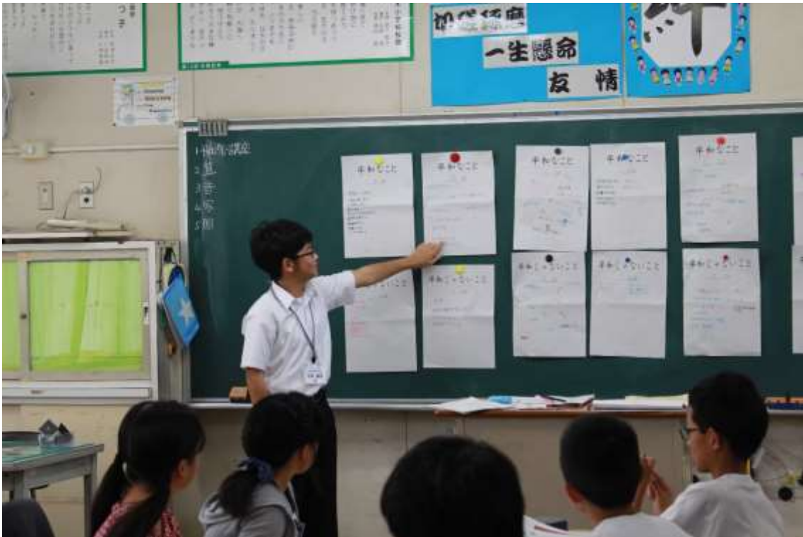
平成 30 年度広島派遣中学生がアシスタントとして参加