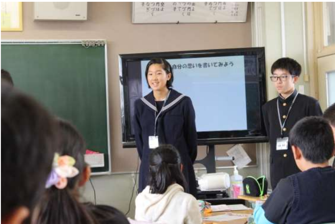
平成 30 年度広島派遣中学生がアシスタントとして参加