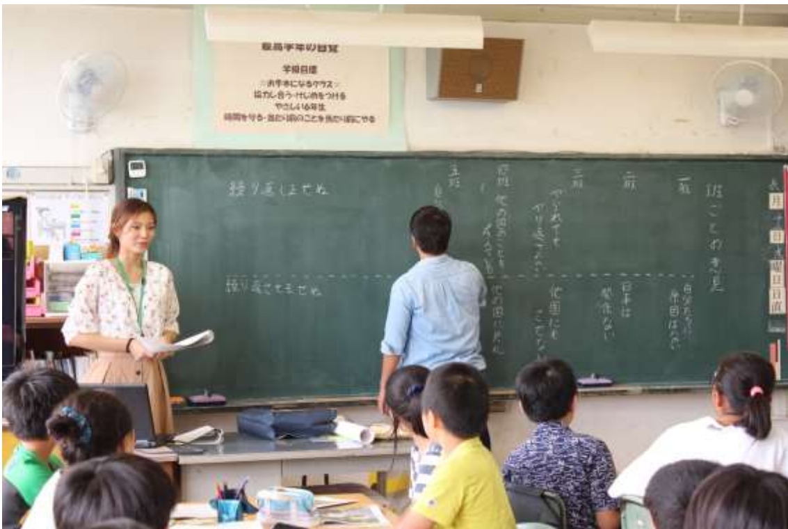
授業をする大学生たち（講師：H25 広島派遣 アシスタント：H21 長崎派遣）