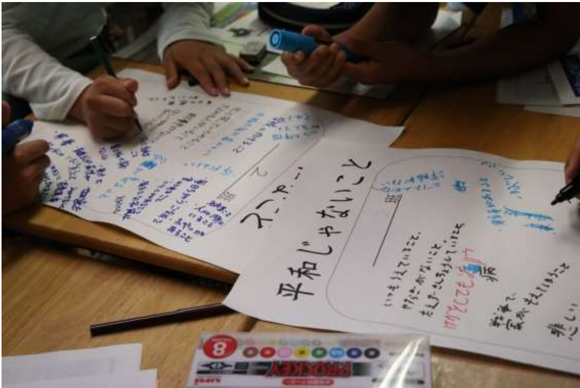
グループワークで「平和なこと」「平和じゃないこと」を書き込む小学生