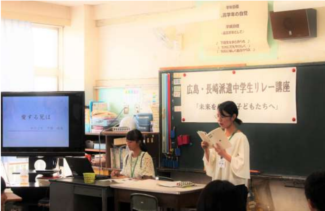
原爆の詩を朗読する大学生（H24 長崎派遣）。アシスタントは高校生（H27 広島派遣）。