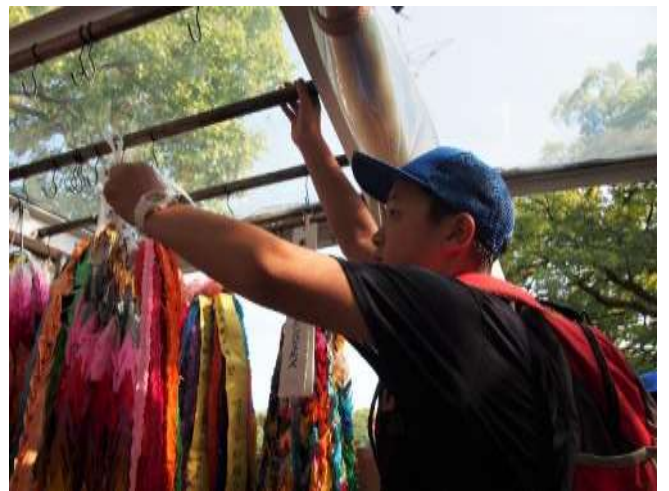
平和記念資料館見学