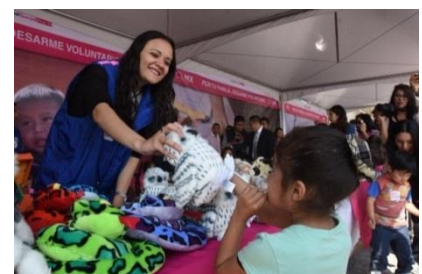
Foto Ciudad de México

El 30 de julio, la Ciudad de México, una ciudad vicepresidenta y líder de Alcaldes por la Paz en México, comenzó la segunda etapa de "Por tu familia, Desarme voluntario" este año, lanzado originalmente en 2012, busca sensibilizar la población con respecto a los riesgos de poseer armas de fuego y municiones, consiste en un intercambio de armas por asistencia económica,