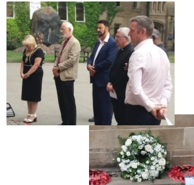
Evento de conmemoración de Hiroshima y Nagasaki en Manchester

Muchos miembros de la sección de Reino Unido e Irlanda organizaron eventos para conmemorar el 73º aniversario de los ataques con armas atómicas de Hiroshima y Nagasaki. Estos se han observado en un informe de política más amplio desarrollado por la Secretaría de la sección que también se centra en su próxima reunión, que se celebrará en torno al Día Internacional de la Paz, el 20 de septiembre en el Ayuntamiento de Clydebank, Escocia. Esta reunión se relaciona con una serie de eventos del ICAN en el Reino Unido que culminarán con una marcha y un mitin desde el campamento de paz de Faslane hasta la entrada de la base naval donde están amarrados los submarinos Trident. La inscripción está abierta para el seminario del día 20, que incluirá oradores de Estados Unidos, el Parlamento escocés y ejemplos locales de mejores prácticas para desarrollar la educación para la paz.