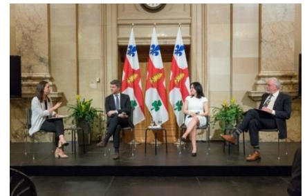
Evento relacionado con la Cumbre del G7 en junio

En abril, Montreal envió una delegación a Ginebra para unirse a la delegación de Alcaldes por la Paz en la Segunda Sesión del Comité Preparatorio para la Conferencia de Revisión del TNP 2020 en Ginebra y en junio, en vísperas de la Cumbre del G7 que tendrá lugar en Charlevoix, Canadá Montreal organizó un evento importante e influyente titulado: "Ciudades, problemas mundiales y el G7", un panel de discusión de alto nivel para destacar el papel de las ciudades en los problemas mundiales, y en particular con respecto a los temas abordados por el G7.