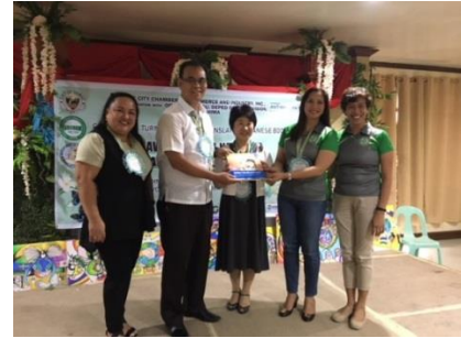
Ceremonia de donación del libro ilustrado

La ciudad de Ormoc, que se unió a Alcaldes por la Paz en julio, está implementando la educación para la paz utilizando un libro ilustrado "Paper Crane Journey". El libro trata sobre Sadako Sasaki, una joven de Hiroshima que murió de leucemia por la radiación diez años después del bombardeo atómico. Mientras estaba en el hospital, dobló grullas de papel para hacer realidad su deseo de mejorar.