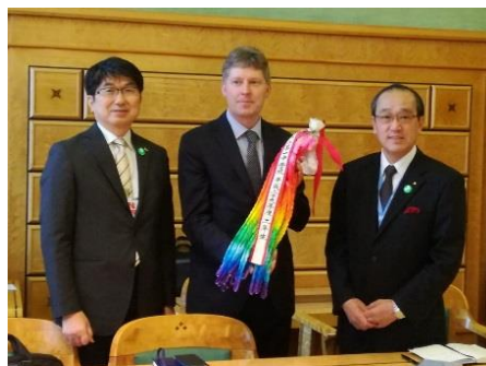
Maire d' Hiroshima (à droite) et le maire de Nagasaki (à gauche) et le président du Comité préparatoire, l'ambassadeur Bugajski de Pologne (le 24 avril)

Le 26 avril, les Maires pour la paix ont organisé un événement parallèle au Comité préparatoire du TNP intitulé «Forum des jeunes». Les jeunes intervenants représentaient le Japon d'Hiroshima, d'Okinawa et de Nagasaki; ils représentaient également deux villes exécutives supplémentaires de Maires pour la paix : Manchester, au Royaume-Uni et Granollers, en Espagne; et représentaient aussi deux ONG (Pax et INESAP). Les jeunes ont tous fait des exposés sur leurs efforts et leurs souhaits pour la paix.