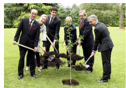
Cérémonie de plantation à Gernika-Lumo