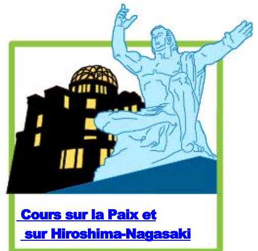
Cours sur la Paix et sur Hiroshima-Nagasaki

Merci d'encourager des universités de votre ville à programmer des cours de la Paix sur Hiroshima-Nagasaki. Qu'ils soient nouvellement établis ou qu'ils existent déjà, ces cours doivent respecter certains critères pour être reconnus comme Cours de la Paix sur Hiroshima-Nagasaki.