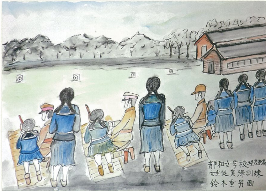
清和女学校現地 女生徒実弾訓練 鈴木重男画