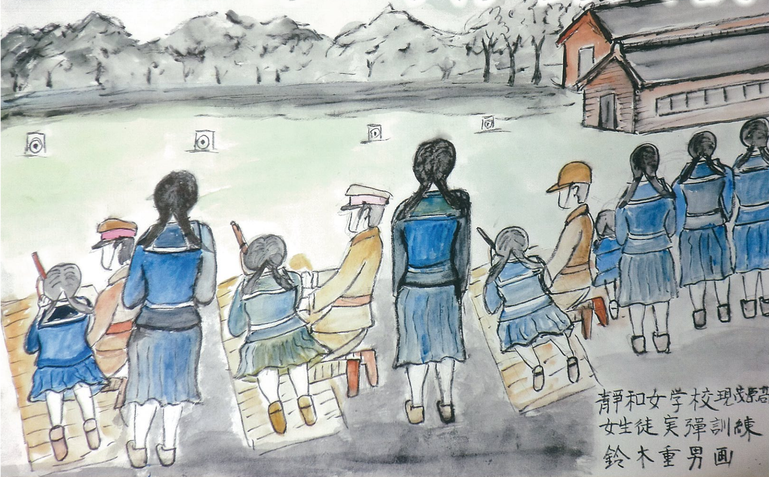
清和女学校現成高 女生徒実弾訓練 鈴木重男画