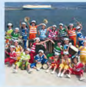
広島ジュニアマリンバアンサンブル《マリンバ》

NHK入局後、東京、大阪、広島の各局に勤務。現在NHK広島放送局チーフ・アナウンサーとして、土曜の朝の「おはよう ちゅうごく」や、「ヒバクシャからの手紙」などの反核・平和関連番組を担当。これまでも「7時のニュース」「吉永小百合平和への絆コンサート」、女性初の「紅白歌合戦」総合司会、「思い出のメロディー」「生活ほっとモーニング」「芸術劇場・演劇」「NHK俳句」など、多くの番組を担当している。