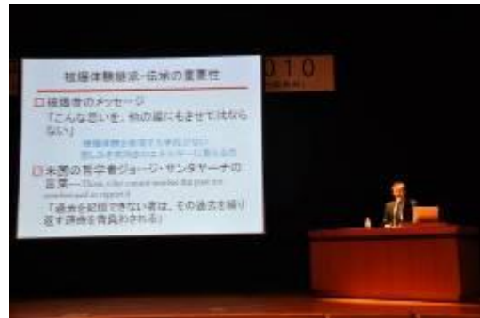
秋葉市長の基調講演