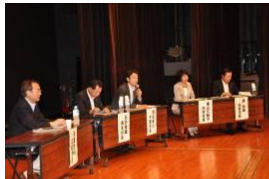
パネルディスカッション