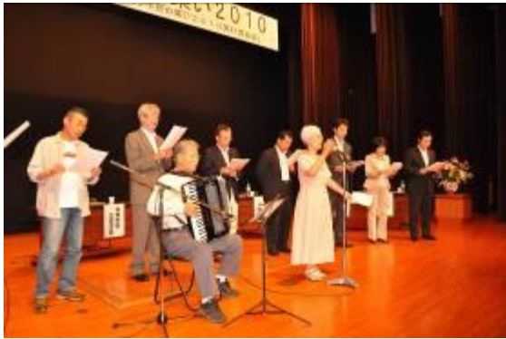
皆で歌った“みんなであたおう”