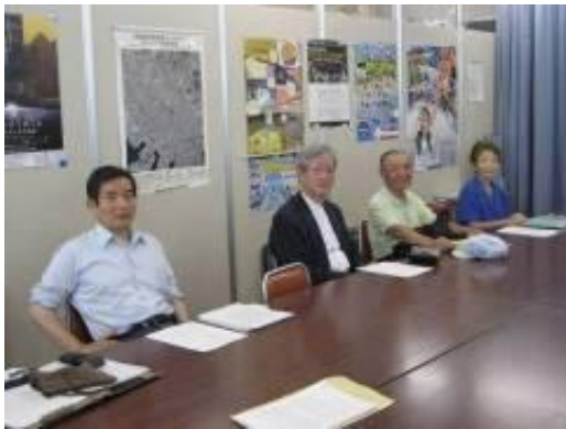
記者会見に顔をそろえた共同代表のみなさん