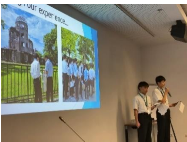
Präsentation von Jugendlichen der Kampagne „Mayors for Peace“ auf dem Forum der Bürgermeister für den Frieden im Büro der Vereinten Nationen (August 2023, Wien)