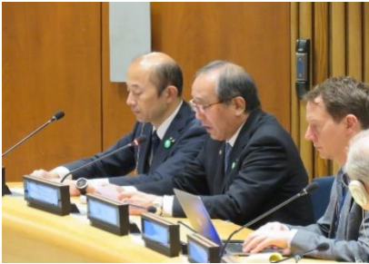
Rede des Präsidenten der 2. Konferenz der Unterzeichnerstaaten des Vertrags über das Verbot von Kernwaffen (November 2023, New York)