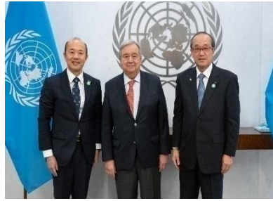
Treffen mit UN-Generalsekretär Guterres (November 2023, New York)