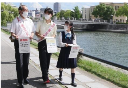
Unterschriftensammlung auf der Straße durch den Präsidenten und Oberschüler*innen (August 2022 in Hiroshima)