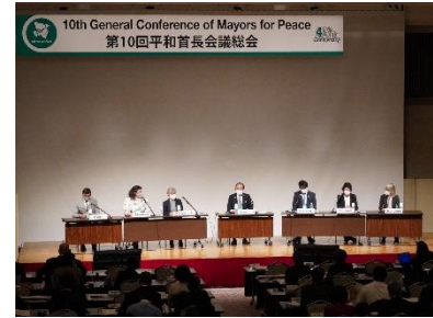
10. Generalversammlung (Oktober 2022 in Hiroshima)

Die Städte im Vorstand treffen sich in der Regel alle zwei Jahre einmal zu einer Vorstandskonferenz in einer der Mitgliedsstädte. Hier werden die Richtlinien der demnächst anstehenden Themen sowie die nächste Generalversammlung besprochen und vorbereitet.