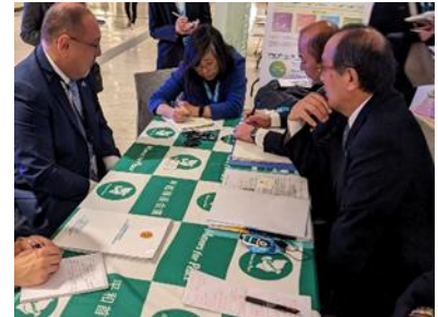
Treffen mit Regierungsvertretern verschiedener Länder (November 2023, New York)