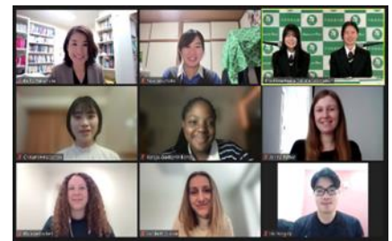
Organisation d'un webinar sur l'éducation à la paix (Février 2024, Hiroshima)