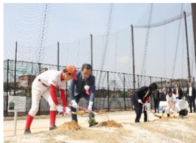
Cérémonie de plantation de plants de la deuxième génération des arbres qui ont survécu à la bombe atomique par des villes participantes (Mars 2024, Obu)