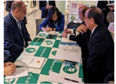
Rencontre avec les représentants de gouvernements nationaux (Novembre 2023, New York)