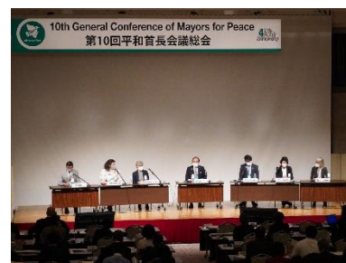
10ème Conférence Générale (Octobre 2022, Hiroshima)

La Conférence exécutive est une conférence pour les villes exécutives, organisée tous les deux ans dans l'une de ces villes afin de discuter de futures initiatives et idées pour la prochaine Conférence générale.