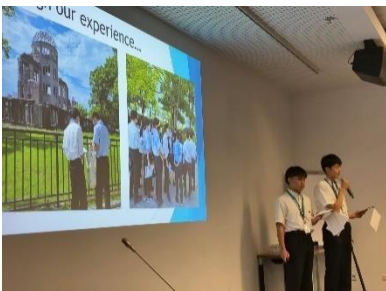
Présentation par les jeunes de Maires pour la Paix lors du forum Jeunesse de Maires pour la Paix organisé par les Nations Unies (Août 2023, Vienne)