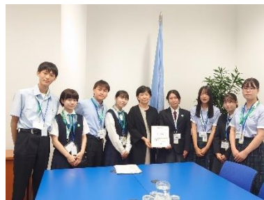
Présentation d'une pétition à un représentant de l'ONU par des étudiants (Juillet 2023, Vienne)