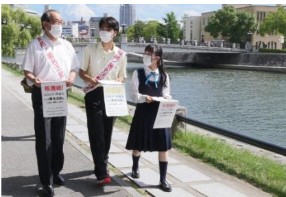
Signature de la pétition par le Président et des étudiants du secondaire (Août 2022, Hiroshima)