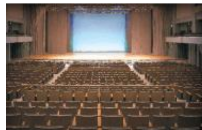
フェニックスホール

メッセージの発表又はパフォーマンスにより、この広島の地から平和のメッセージを発信してください。核兵器廃絶と世界恒久平和の実現を願う「ヒロシマの心」に共感した取組であれば、表現方法は自由です（例：メッセージの発表、活動内容の報告、歌、演劇など）。なお、発表時間は1団体7分以内です。