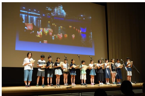
神奈川県茅ヶ崎市平和大使によるメッセージ発表

8月6日は、広島の平和記念日。 昨年はこの「ひろしま子ども平和の集い」に、全国から10団体が参加し、それぞれの平和への思いを、言葉や音楽など様々な形で発表しました。 皆さん一緒に、この広島の地から、平和のメッセージを発信しませんか！