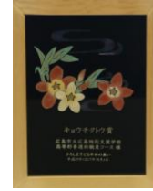
キョウチクトウ賞