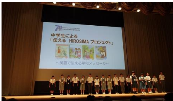
中学生による「伝える HIROSHIMA プロジェクト」