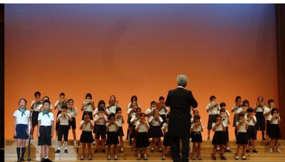
広島市立千田小学校合唱隊による発表