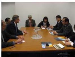
トートCTBTO事務局長との面会

平和市長会議代表団は、ウィーン滞在中、ノルウェー大使やスリランカ大使、包括的核実験禁止条約機関(CTBTO)事務局長と面会し、2020