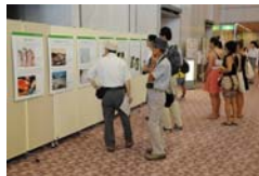
8月6日、広島市平和文化イベントでのポスター展の様子

また、役員都市等の協力により、現在、日本語、英語、ドイツ語、フランス語、ロシア語、オランダ語、スペイン語、カタルーニャ語の8言語版が用意されています。