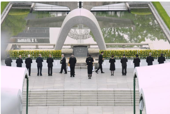
平和記念式典(広島市)

原爆投下から 75 年を迎えた 8 月 6 日・9 日に、広島市・長崎市では平和記(祈)念式典が厳かに挙行されました。今年の式典は、新型コロナウイルスの感染拡大防止のため、世界中から被爆地に多くの人々を招待することができず、例年に比べ規模を大幅に縮小したものとなりました。しかし、自国第一主義が台頭する中、核軍縮の動きを停滞させるわけにはいきません。それぞれの式典において、両市長は、核兵器廃絶とその先にある世界恒久平和の実現に向けた「平和宣言」を行いました。