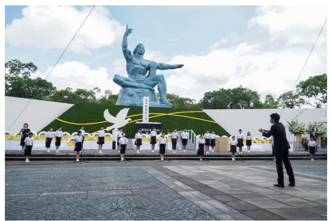
平和祈念式典(長崎市)