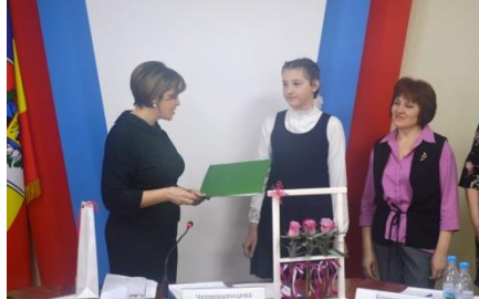
▲ロシア・ウリュピンスク市