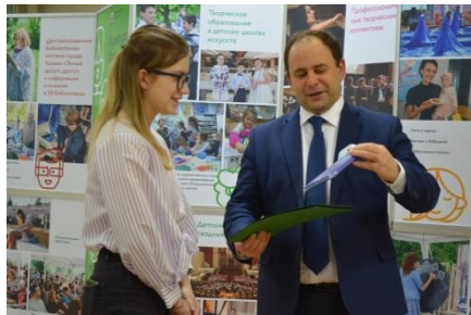
▲ロシア・カザニ市

▼子どもたちによる“平和なまち”絵画コンテスト 受賞作品(平和首長会議ウェブサイト):