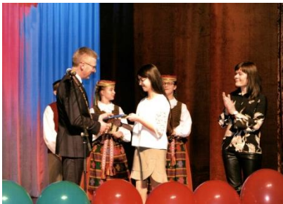
▲リトアニア・ユルバルカス市