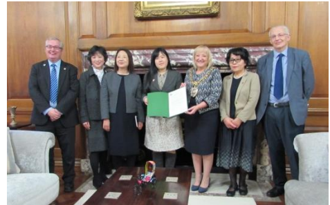
マンチェスター市長(右から3番目)を表敬訪問する派遣団

平和首長会議副会長都市であり、英国・アイルランド支部のリーダー都市でもあるマンチェスター市とその近郊に位置するオールダム・タウン、「和解と平和」を呼びかける平和都市として知られるコベントリー市が、11月上旬、被爆体験伝承講話会と被爆体験記朗読会を実施しました。