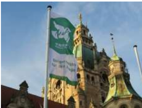
Le drapeau des Maires pour la Paix devant l'Hôtel de Ville de Hanovre

https://www.hannover.de/Service/Presse-Medien/Landeshauptstadt-Hannover/Aktuelle-Meldungen-und-Veranstaltungen/%22Frieden-2020-%22-Veranstaltungsreihe-wird-digital-umgesetzt