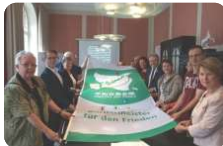
Initiative annuelle "Flag Day" (Journée du drapeau)

Hanovre a organisé divers événements impliquant de nombreuses villes membres allemandes, tels que la Journée du drapeau et des conférences régionales, et a fourni des informations actualisées présentant les activités sur le site web de la section allemande . En outre, le personnel du secrétariat de la section a communiqué de manière constante avec les villes non membres en Allemagne et leur a demandé de rejoindre notre organisation, et le nombre de villes membres en Allemagne continue de croître. (Nouvelles villes membres en Allemagne : | 2017 : 68 | 2018 : 71 | 2019 : 69 |)