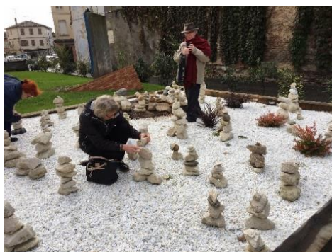
Le jardin des Sentinelles de la paix réalisé par la ville de Moissac et l'Association

Cette ville a réalisé un jardin de "sentinelles de la paix", tours de pierres ayant pour but de transmettre aux jeunes générations un message souvenir des guerres pour la paix. Cette installation de pierres superposées symbolise la fragilité des oeuvres humaines qu'il faut protéger et sans cesse reconstruire.