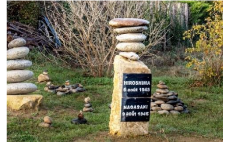
Tours réalisées avec des pierres, "sentinelles de la paix".

Dans ce parc il y a des "sentinelles de la paix" qui sont des tours de pierres superposées rappelant le souhait des survivants de Hiroshima et de Nagasaki de parvenir à l'élimination des armes nucléaires et à la paix du monde. Après l'inauguration, les enfants ont récité un poème pour la paix et chanté une chanson de la paix. Ensuite, lecture de poèmes par Miho Shimma, Ambassadrice de la ville d'Hiroshima et par un poète africain.