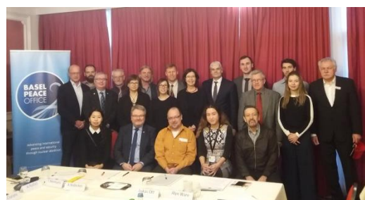
Participantes de la reunión conjunta entre Alcaldes por la Paz y PNND el 15 de enero.

El Foro reunió a más de 150 personas de ciudades, parlamentarios, ONG y la sociedad civil durante dos días, el 13 y 14 de enero, para discutir formas innovadoras de desarrollar la paz. Los miembros de Alcaldes por la Paz ayudaron a la PNND en un pabellón especial a "contar" 27,000 millones de euros de exportaciones de armas de Europa, y elegir cómo se podría gastar mejor ese dinero usando los Objetivos de Desarrollo del Milenio de las Naciones Unidas. Una reunión especial que incluyó una presentación del alcalde diputado de Hannover sobre las políticas de la ciudad en materia de paz, desarme y desinversión. Otros oradores fueron la eurodiputada del Reino Unido Molly Scott-Cato, la vicepresidenta de PNND, Christine Muttonen, y una oradora de Fossil Free Germany.