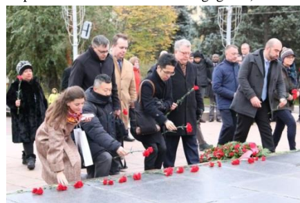
Participantes de la Asamblea General de IAPMC depositando flores en el Eternal Fire Memorial en Volgograd