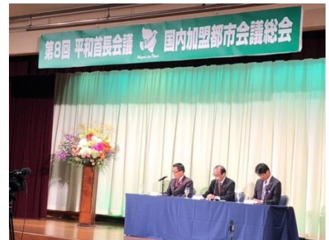
Conferencia de prensa sobre la reunión de las ciudades miembro japonesas por los alcaldes de Takayama, Hiroshima y Nagasaki el 6 de noviembre.

El 5 y 6 de noviembre, se celebró la 8ª Reunión de Ciudades Miembro de Japón en la ciudad de Takayama, en la Prefectura de Gifu, a la que asistieron 148 representantes de 91 municipios, incluidos 39 jefes municipales. Los participantes discutieron y aprobaron los puntos de la agenda, incluida la presentación de una carta de solicitud al gobierno japonés y la intensificación de los esfuerzos en la expansión de la membresía a través de la invitación a ciudades hermanas y de amistad.