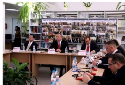
Mesa redonda del Foro Internacional de Diplomacia Popular

http://www.mayorsforpeace.org/english/whatsnew/activity/181206_50-50_Hiroshima.html