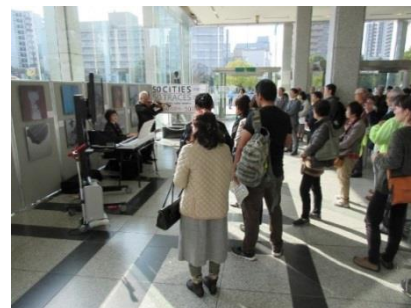
La ceremonia de apertura el 18 de noviembre. (Foto: Secretaría de Alcaldes por la Paz).