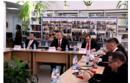
Round table of the International Forum of People's Diplomacy

<Rapport du secrétariat de Mayors for Peace>