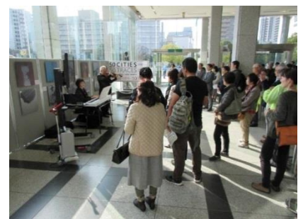
The opening ceremony on Nov 18