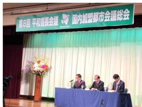
Press conference on the Japanese Member Cities Meeting by the Mayors of Takayama, Hiroshima, and Nagasaki on November 6

Les 5 et 6 novembre, la 8e assemblée des villes membres japonaises s'est tenue à Takayama, dans la préfecture de Gifu, en présence de 148 représentants de 91 municipalités, dont 39 responsables municipaux. Les participants ont examiné et approuvé les points de l'ordre du jour, notamment la soumission d'une lettre de demande au gouvernement japonais et l'intensification des efforts visant à accroître le nombre de membres en invitant des villes jumelées.