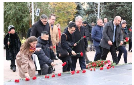
Participants of the IAPMC General Assembly laying flowers to the Eternal Fire Memorial in Volgograd