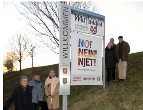
Peace group members beside the town sign of Mutlangen, Germany

<Rapport d'Evelyn Kamissek, Bureau des affaires internationales de la ville de Hanovre>