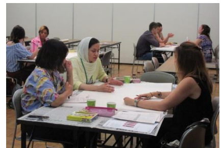
Mayors for Peace program of "HIROSHIMA and PEACE" on August 3

Dans le cadre de ce programme de soutien, neuf jeunes représentants de neuf villes membres du monde entier ont assisté au cours d'été intensif "HIROSHIMA et PEACE" de l'université de la ville d'Hiroshima, dans le cadre duquel des étudiants du monde entier étudient et discutent d'Hiroshima et de la paix. En plus du cours de l'université, ils ont participé au programme de Maires pour la Paix, au cours duquel ils ont échangé des points de vue sur leurs futures activités de paix.