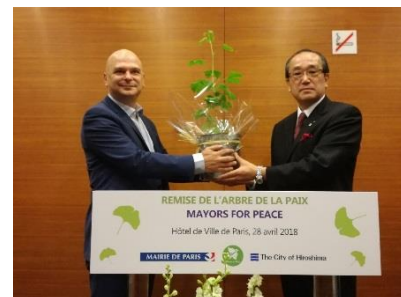
Alcalde de Hiroshima entregando una planta al teniente de alcalde de París