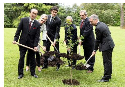
Ceremonia de plantación en Gernika-Lumo

El 29 de abril, en Gernika-Lumo, se llevó a cabo una ceremonia de siembra de una planta de Ginkgo en un parque ubicado detrás del Parlamento de Bizkaia. La ceremonia se llevó a cabo en el contexto del 81º aniversario del bombardeo de Gernika en 1937. Tras las declaraciones del alcalde Matsui; Gorroño, alcalde de Gernika-Lumo; Urkullu, presidente del Gobierno Vasco; y Otadui, presidenta del Parlamento de Bizkaia, la semilla fue plantada con muchos ciudadanos y turistas mirando. Entre los invitados que se unieron a la ceremonia de siembra estaba el alcalde Mayoral de Granollers. Granollers, es una ciudad vicepresidente y líder de la región catalana de Alcaldes por la Paz que ha estado alimentando activamente a los Ginkgo