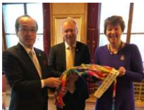
El alcalde Matsui entrega una corona de grullas de papel a la alcaldesa de Oslo (derecha) y al gobernador de Oslo (centro).

Además de asistir a diversos eventos relacionados con el Premio de la Paz, los dos Alcaldes se reunieron e intercambiaron puntos de vista con los cancilleres de México y Costa Rica, y los embajadores de Austria, México, Irlanda y Costa Rica, los estados que lideraron las negociaciones del Tratado. También se reunieron con el Alcalde de Oslo, que se unió a Alcaldes por la Paz el año pasado, y algunos de los miembros ejecutivos de Alcaldes por la Paz en Europa: Frogn (Noruega), Biograd na Moru (Croacia) y Manchester (Reino Unido) para discutir el fortalecimiento de la colaboración para crear un mayor impulso hacia un mundo sin armas nucleares.