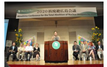
Publicación del “Llamamiento de Hiroshima” en la Conferencia de Hiroshima para la Eliminación Nuclear ( julio de 2010)

En el Comité Preparatorio de la Conferencia de Revisión del TNP celebrado en Ginebra en 2008, dimos a conocer el “Protocolo de Hiroshima y Nagasaki” que señala los procesos a seguir hasta 2020 para la eliminación de las armas nucleares. Desde entonces, a lo largo de 2 años, hemos pedido al gobierno de cada país, etc., la comprensión y aprobación de dicho Protocolo. Al mismo tiempo, hemos reunido firmas de aprobación de los alcaldes y, como consecuencia, hemos conseguido más de 1,600 firmas de aprobación. Aunque el Protocolo no ha sido aprobado en la Conferencia de Revisión del TNP, ha sido indicado, en el documento de acuerdo de dicha Conferencia, el mismo contenido que el del Protocolo (la necesidad de un marco legal así como un período límite concreto para la eliminación de las armas nucleares, etc.) Se puede decir que es el resultado del llamamiento que hemos realizado en el Protocolo para eliminar inmediatamente las armas nucleares.