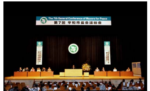
제 7 회 평화시장회의의 총회

사무국:공익재단법인 히로시마평화문화센터 국제부평화연대추진과 TEL : 082-242-7821 FAX : 082-242-7452 E-mail : mayorcon@pcf.city.hiroshima.jp URL : http://www.mayorsforpeace.org/jp/index.html