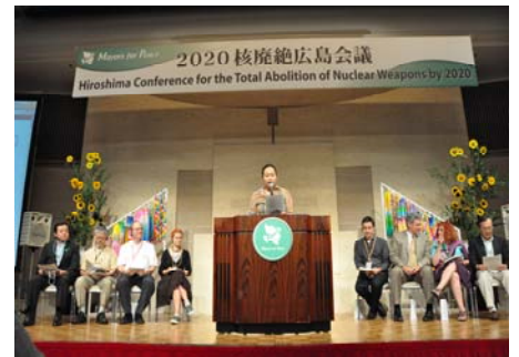
2020 핵무기 근절 히로시마회의에서 ‘히로시마 청원(Hiroshima Appeal)’을 발표(2010년 7월)

2008년 제네바에서 개최된 NPT 재검토회의준비위원회에서 2020년까지 핵무기 근절을 위한 구체적 프로세스를 표명한 ‘히로시마·나가사키 의정서’를 발표하고 2년간에 걸쳐 각국 정부 등에 동의정서에 대한 이해와 찬동을 요청해 왔습니다. 동시에 수장 등에 대한 찬동서명활동도 전개하여 1,600 이상의 자치단체 수장으로부터 찬동을 받았습니다. 2010년 5월 NPT 재검토회의에서 의정서 채택은 실현되지 않았으나 동 회의의 합의문서에 의정서의 취지와 같은 내용(핵무기 근절을 위한 법적 테두리와 구체적인 기한의 필요성 등)이 포함되었습니다. 의정서가 국제사회에 핵근절의 긴급성을 호소한 성과라 할 수 있습니다.