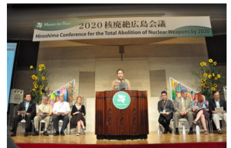
在2020废除核武器广岛会议上发表“广岛呼吁”(2010年7月)

在这成果之下,2010年7月和志同道合的国家、城市、NGO共同举办了“2020废除核武器广岛会议”,要求提前开始交涉核武器禁止条约等,通过了为进一步推进议定书过程的“广岛呼吁”。