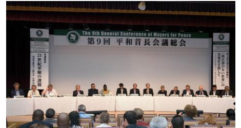
Novena Conferencia general de Alcaldes por la Paz (Agosto 2017, Ngasaki)