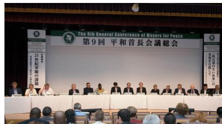
9-ая Генеральная конференция международной организации «Мэры за мир» (август 2017, Нагасаки)