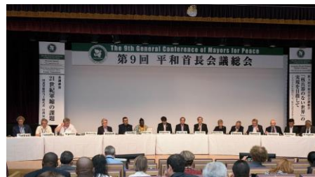
9-ая Генеральная конференция международной организации «Мэры за мир» (август 2017, Нагасаки)