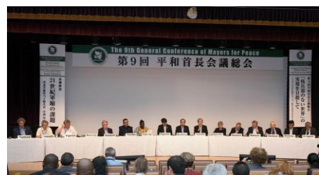
9ª Conferência Geral da Rede Prefeitos pela Paz (Nagasaki, agosto de 2017)