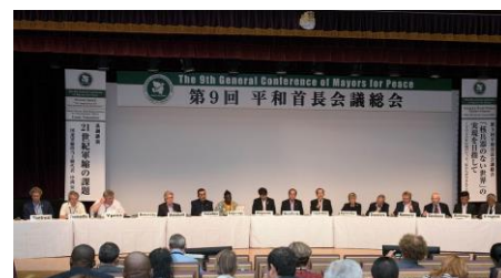
9ª Conferência Geral da Rede Prefeitos pela Paz (Nagasaki, agosto de 2017)