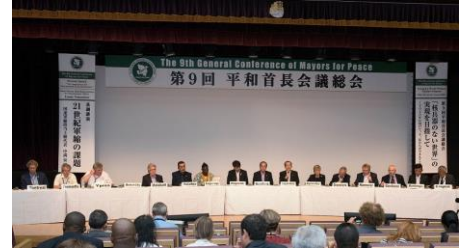
제 9 회 평화수장회의 총회 (2017 년 8 월 나가사키)