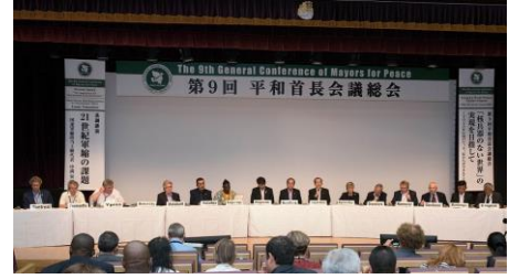
제 9 회 평화수장회의 총회 (2017 년 8 월 나가사키)