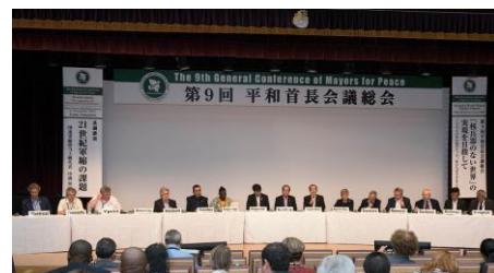
Nona Conferenza Generale Sindaci per la Pace (Agosto 2017, Nagasaki)