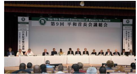
9. Generalversammlung von Mayors for Peace in Nagasaki (August 2017)